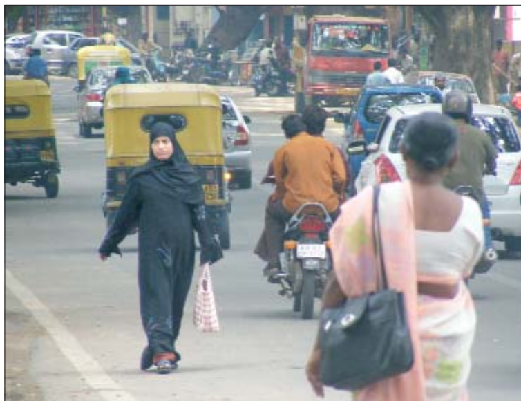
Realtà quotidiana per le vie di Bangalore.

La ricchezza dell'accoglienza, delle espressioni culturali e