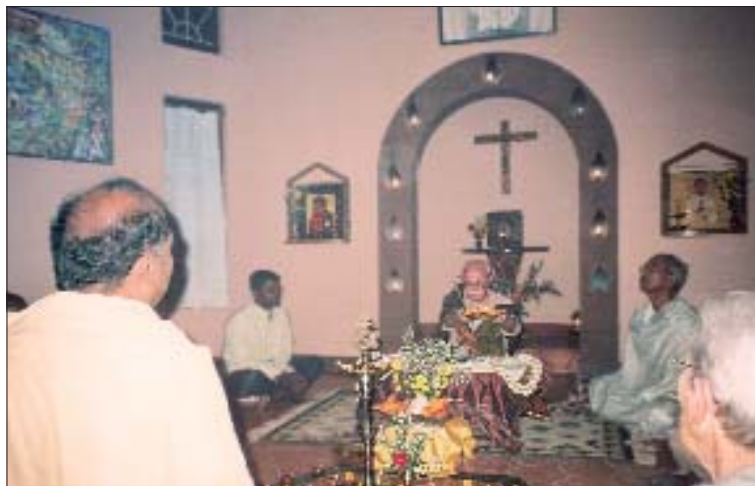
Liturgia alla Fraternità.