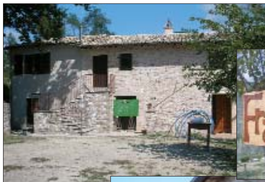
Eremito: Beata Angela.