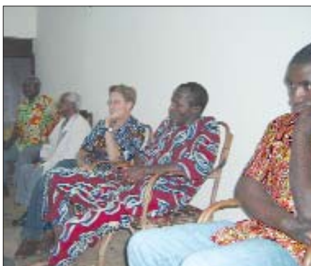
Momenti di riflessione - Africa centrale.

Prima di tutto, ascoltando i fratelli, cercando di comprendere come essi orientano la loro vita e le loro scelte alla nostra vocazione; come fanno il legame tra Nazaret ed il loro comportamento. Cercare il Volto Dio nella vita di ogni giorno, condividere la vita dei poveri è impor-