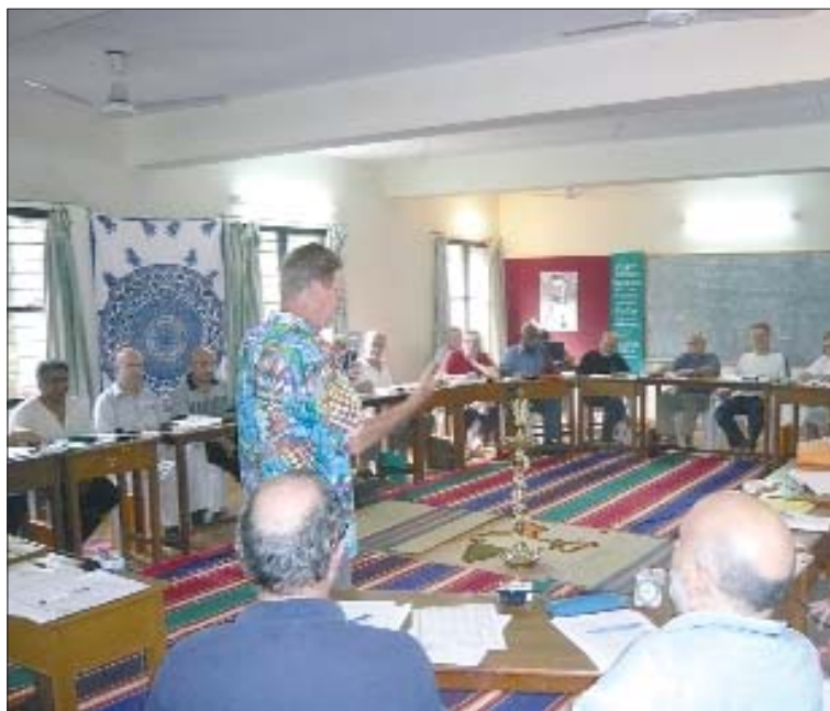
Assemblea generale: Capitolo di Bangalore.

L'ultimo Capitolo si è tenuto a Bangalore nel Sud dell'India, in una casa di formazione dei