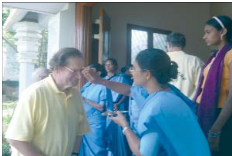
... accoglienza ...indiana!

rituali - che hanno apportato luce e bellezza alle celebrazioni liturgiche - hanno incantato i fratelli; pregare con dei fiori, con la danza, simboli attinti alla tradizione indiana, é stato per parecchi una straordinaria scoperta!